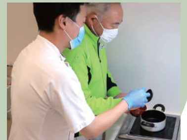
日常生活活動への支援