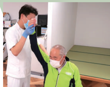
機能回復への支援